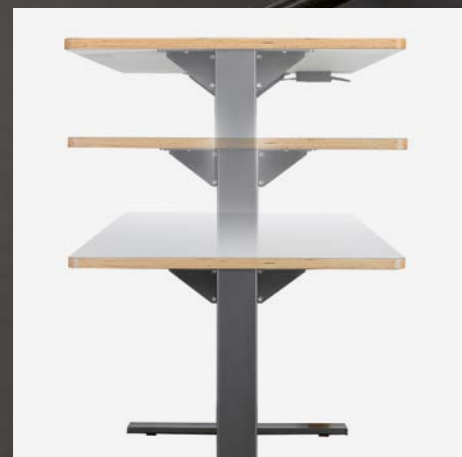
Höhenverstellbar Hauteur réglable

Pour toutes les zones où des tables individuelles ne sont pas l'idéal, p. ex. les salles ACT/ACM ou les salles de groupes, ScuolaBOX propose des tables avec des surfaces plus grandes et avec un réglage à gaz, ce qui permet un travail assis ou debout. Des roulettes intégrées permettent un placement flexible.