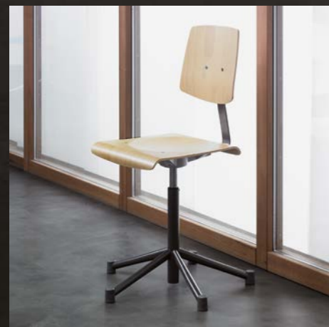
Buche natur Hêtre naturel