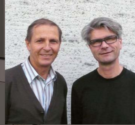
Produktdesign: Ivo Vesely und Roland Eberle

Ein leichter und mobiler Tisch ist das Grundelement des Einrichtungssystems ScuolaBOX. Zusammen mit dem Stuhl ScuolaFLEX lassen sich zukunftsorientierte Bildungsräume mit unterschiedlichen Anforderungen flexibel und ergonomisch realisieren.