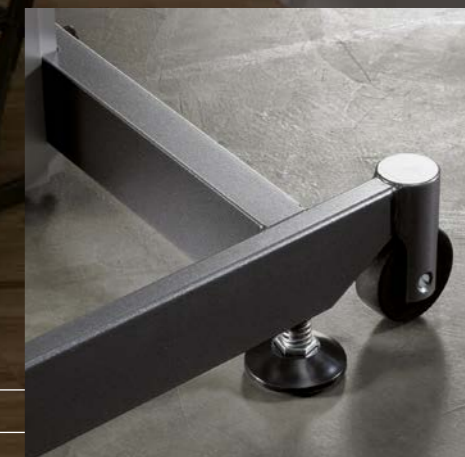
Verstellgleiter/Rollen Patins réglables/roulettes