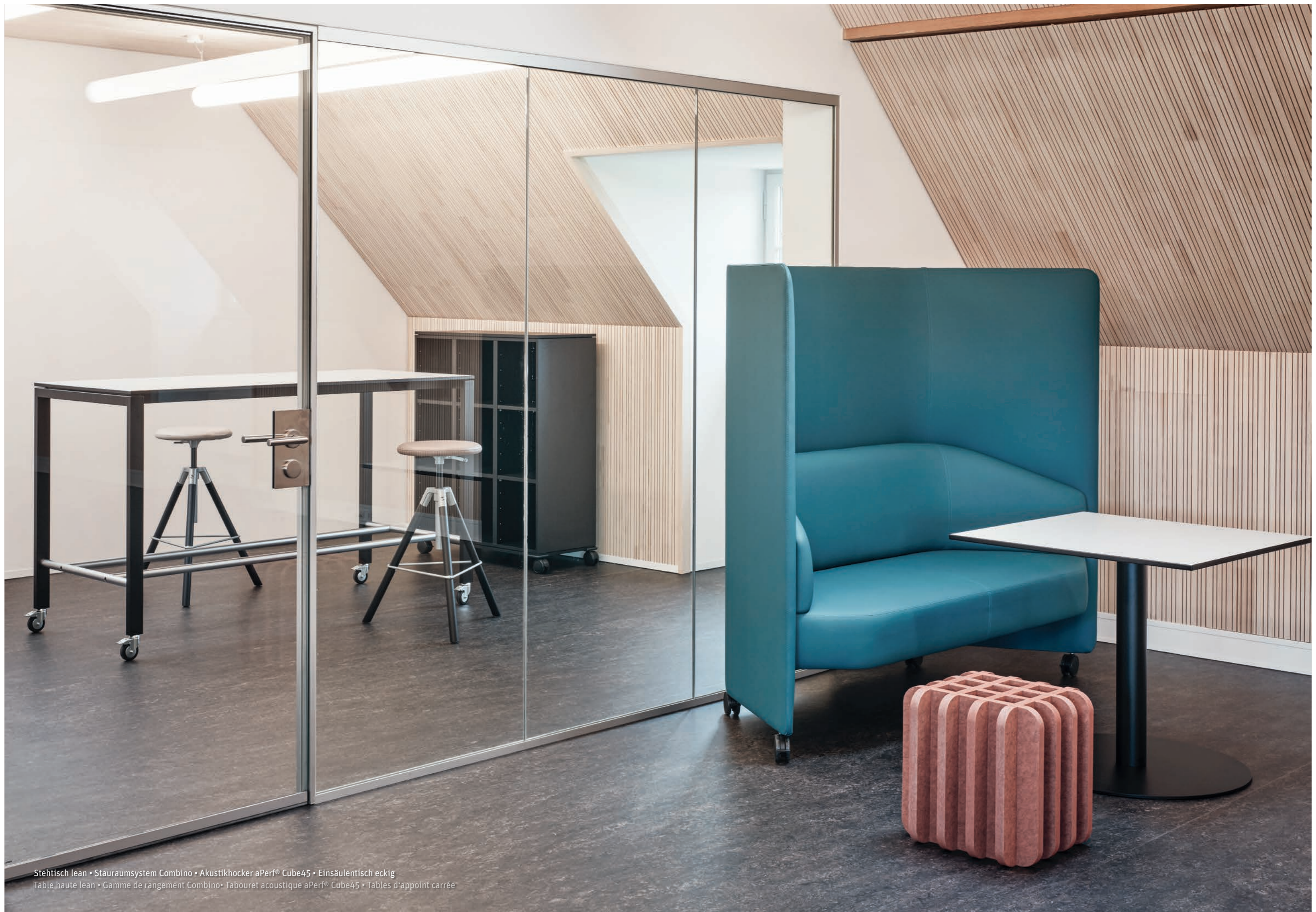
Stehtisch lean • Stauraumsystem Combino • Akustikhocker aPerf® Cube45 • Einsäulentisch eckig Table haute lean • Gamme de rangement Combino • Tabouret acoustique aPerf® Cube45 • Tables d'appoint carrée