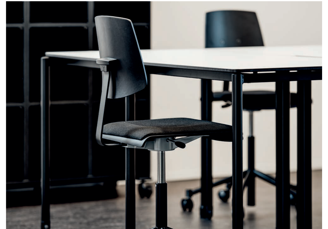
Vierfüsstisch KO25 • Schülerstuhl ScuolaFlex • Stauraumsystem Combino Table à quatre pieds KO25 • Chaise scolaire ScuolaFlex • Gamme de rangement Combino