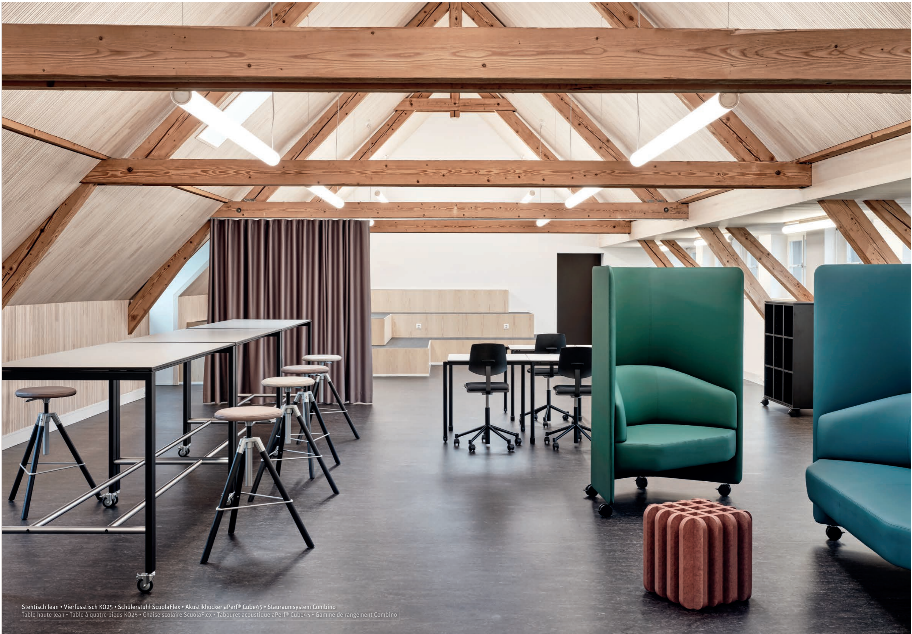
Stehtisch lean • Vierfusstisch KO25 • Schülerstuhl ScuolaFlex • Akustikhocker aPerf® Cube45 • Stauraumsystem Combino Table haute lean • Table à quatre pieds KO25 • Chaise scolaire ScuolaFlex • Tabouret acoustique aPerf® Cube45 • Gamme de rangement Combino