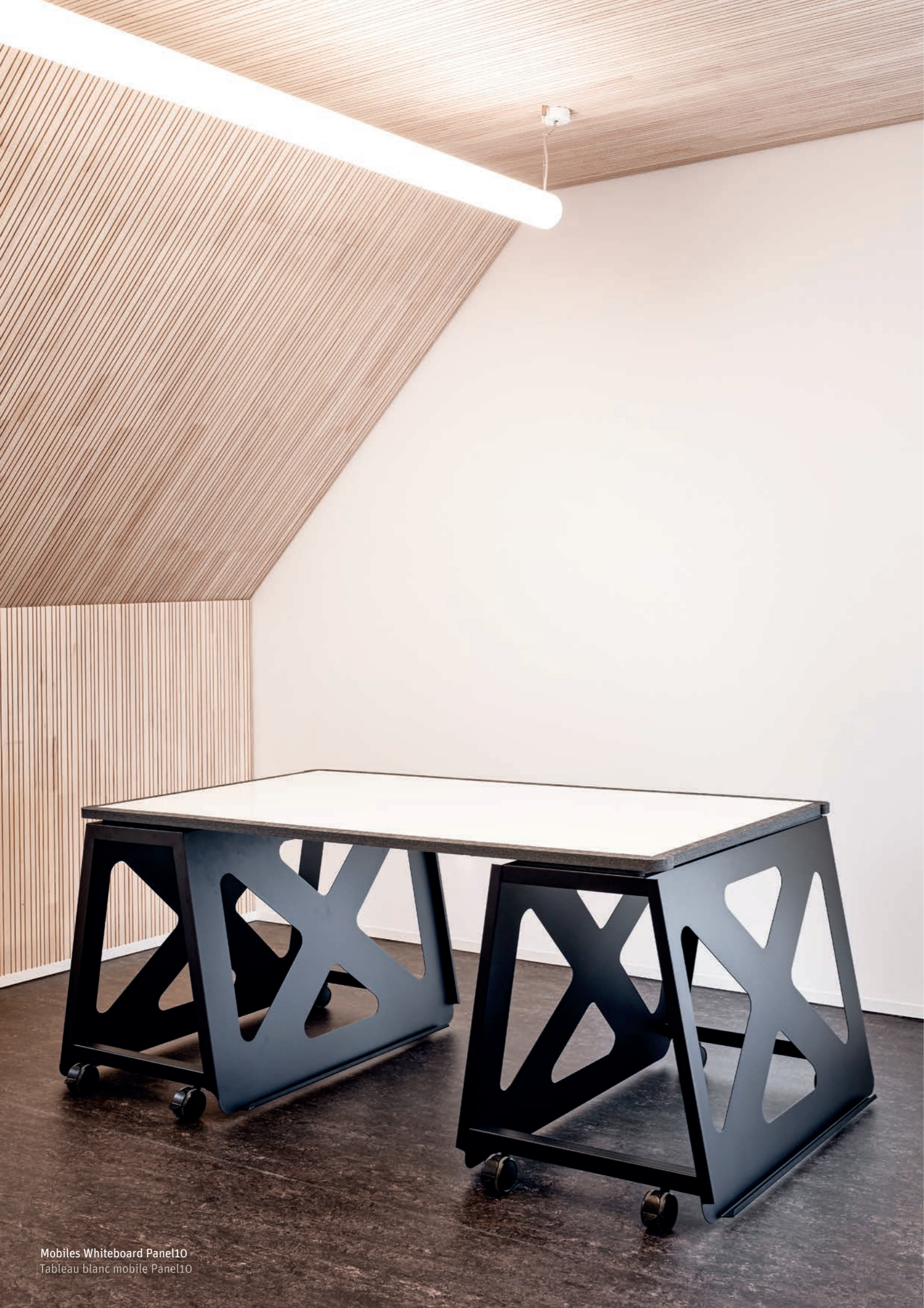
Mobiles Whiteboard Panel10 Tableau blanc mobile Panel10