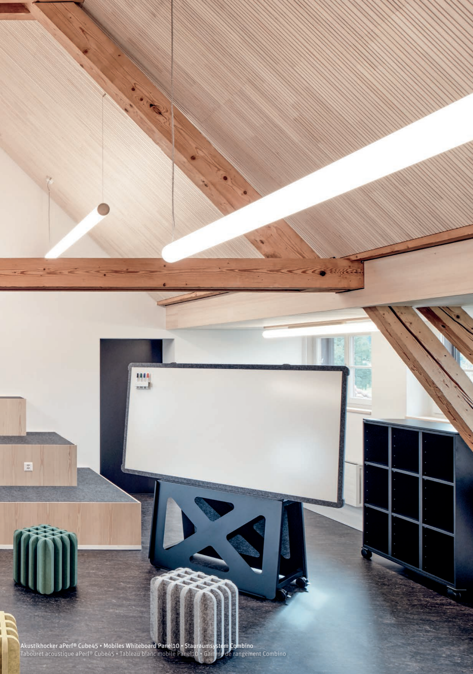
Akustikhocker aPerf® Cube45 • Mobiles Whiteboard Panel10 • Stauraumsystem Combino Tabouret acoustique aPerf® Cube45 • Tableau blanc mobile Panel10 • Gamme de rangement Combino