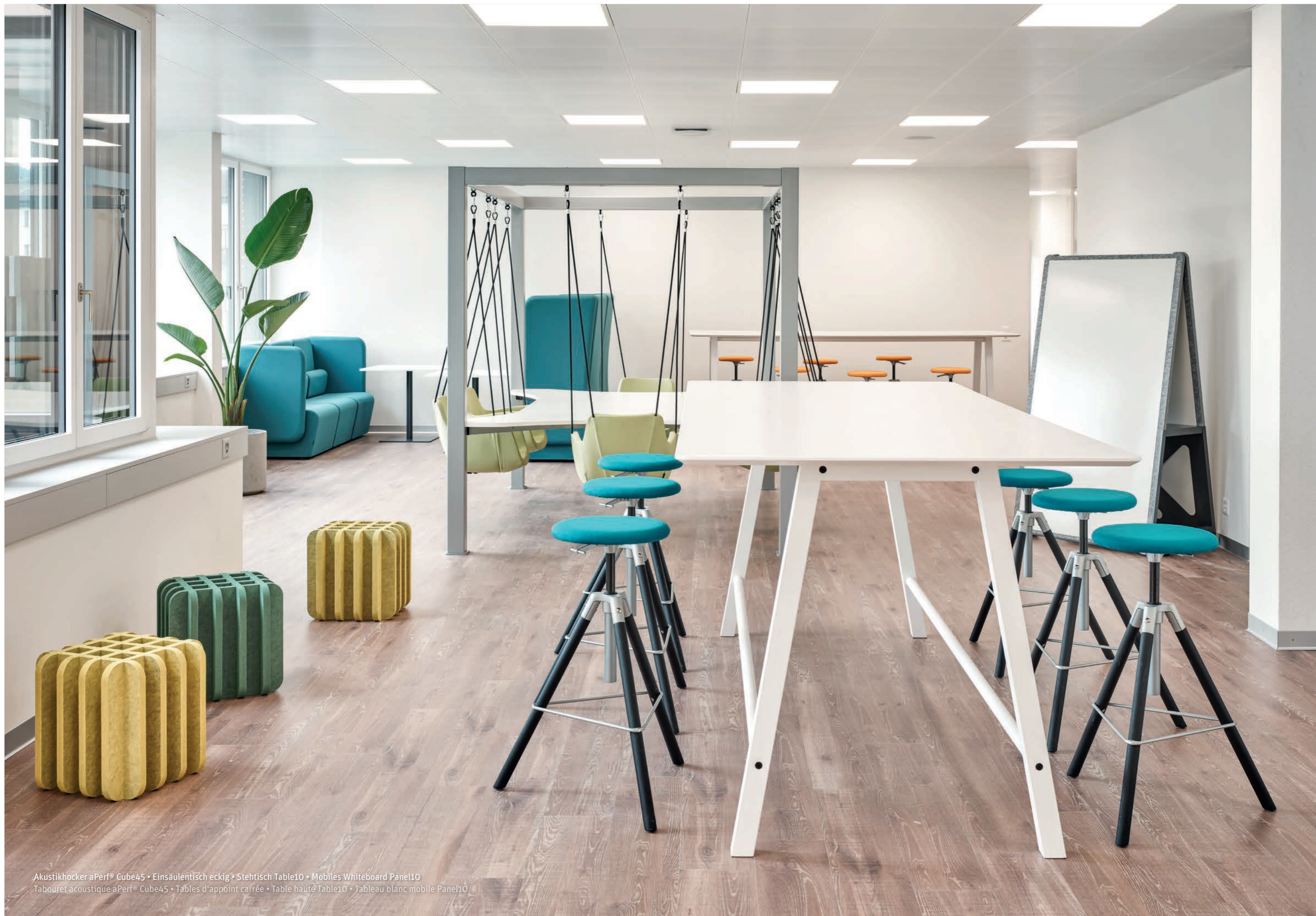
Akustikhocker aPerf® Cube45 • Einsäulentisch eckig • Stehtisch Table10 • Mobiles Whiteboard Panel10 Tabouret acoustique aPerf® Cube45 • Tables d'appoint carrée • Table haute Table10 • Tableau blanc mobile Panel10