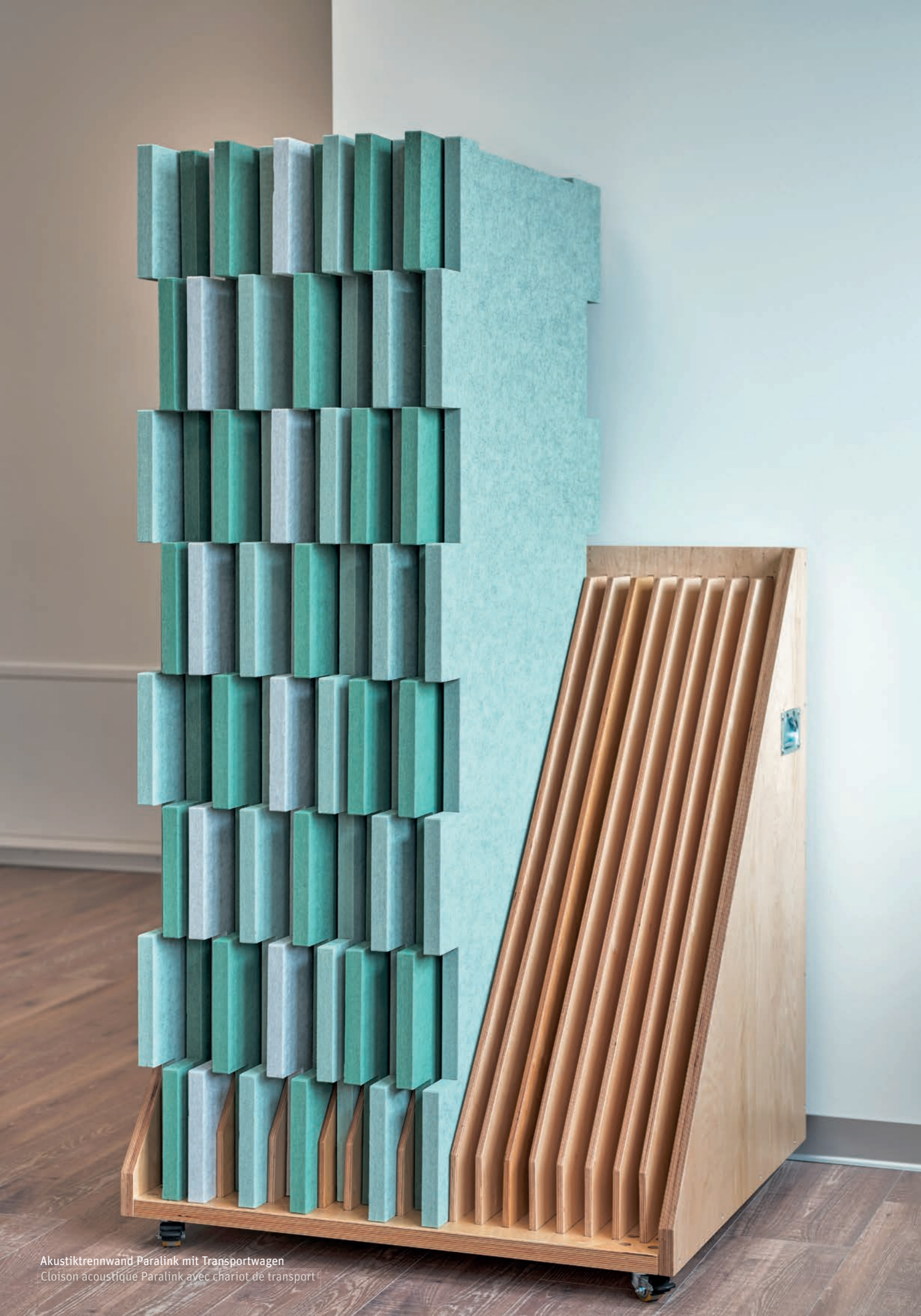
Akustiktrennwand Paralink mit Transportwagen Cloison acoustique Paralink avec chariot de transport