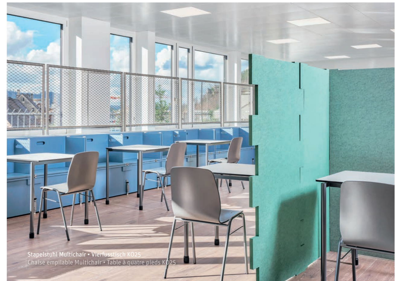
Stapelstuhl Multichair • Vierfusstisch K025 Chaise empilable Multichair • Table à quatre pieds K025