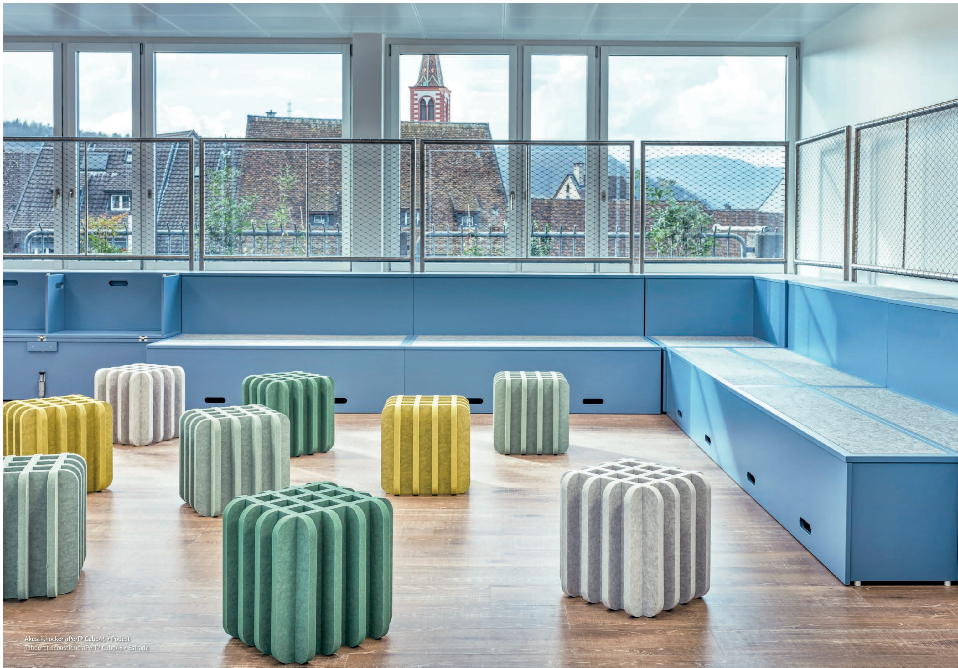
Akustikhocker aPerf® Cube45 • Podest Tabouret acoustique aPerf® Cube45 • Estrade