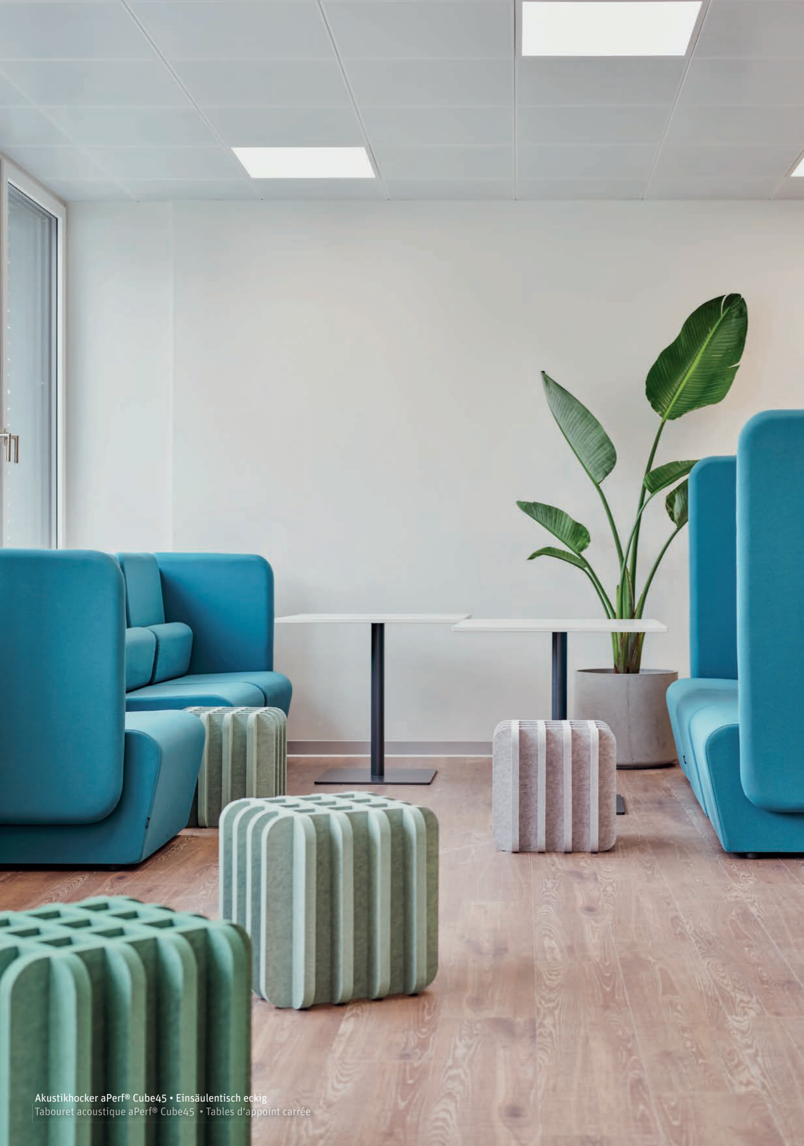
Akustikhocker aPerf® Cube45 • Einsäulentisch eckig Tabouret acoustique aPerf® Cube45 • Tables d'appoint carrée